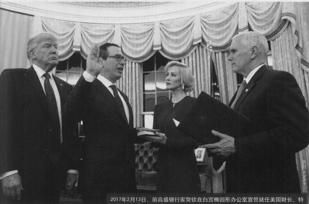
2017年2月13日，前高盛银行家努钦在白宫椭圆形办公室宣誓就任美国财长，特朗普总统、彭斯副总统出席。努钦将负责税改、金融监管及对外经济政策事务。

找到联邦政府试图通过减税鼓励利润回流但效果不佳的先例。2004年《美国就业机会创造法案》规定，在规定期限内，只要跨国公司汇回海外利润，即可享受5.25%的超低“特赦”税率。但企业反响并不积极，有843家公司调回利润，金额共计3120亿美元，且汇回资金的90%都被用于回购、派息和发放高层薪酬，而非研发或制造业投资。