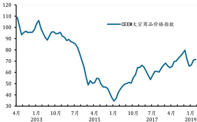
图 3 全球大宗商品价格：2019 年 9 月